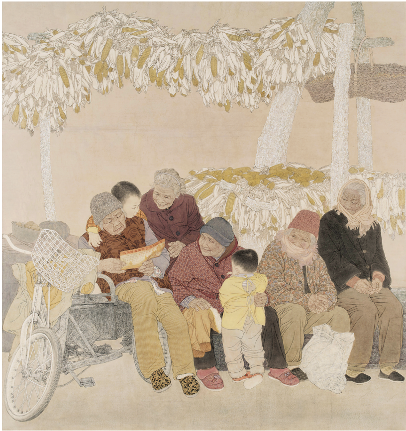
何彦萍《二月二》(中国画)。