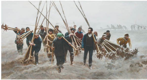
郭建明《粮安天下》(中国画)。

油画《乡村记之一》的画面中,右边坐着一位年长的妇女,手和脸上布满常年劳作的沧桑痕迹,左边的年轻