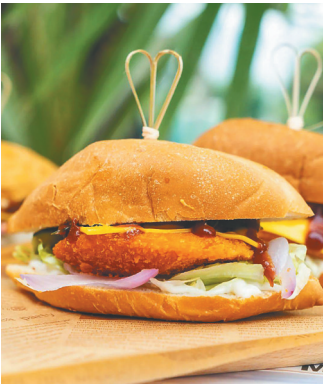
澳门猪扒包。资料图

我宁愿我从没吃过猪扒包,这样它在我心中还能留一席之地。这感觉,就好比在漫展上看到一位惊为天人的小姐姐,日后却得知她是男扮女装的那种失落感。此时的我还是有些不信邪:被央视收录的美