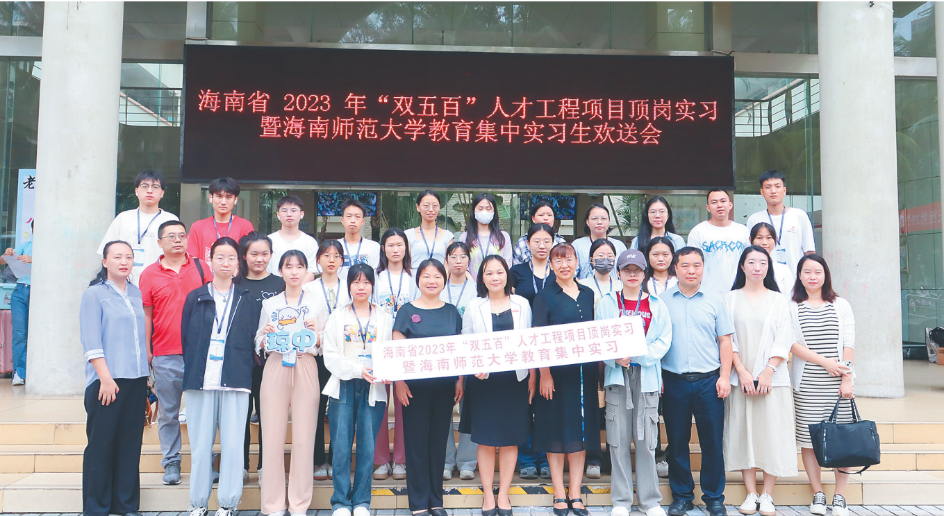
9月11日，海师实习生参加顶岗和教育集中实习。

为彰显师范大学的“本色”与“特色”，建立“职前培养—入职指导—职后培训”一体化教师教育体系，海南师范大学于2019年整合教师教育资源，成立了教师教育学院。四年来，教师教育学院按照“四有”好老师和“大先生”的培养标准，落实立德树人的根本任务，秉承“崇德尚学、求是创新”校训，不负“琼岛名校、教师摇篮”美誉，遵循立院办学的基本定位，积极推进教育教学改革，创新协同育人机制，推动高师教育与基础教育深度融合。