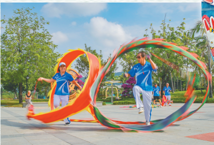
三亚不断完善城市公园的基础设施,为市民和游客提供舒适、便利的生活环境。