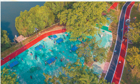
三亚河畔的白鹭公园,每天都吸引市民、游客前来晨练。