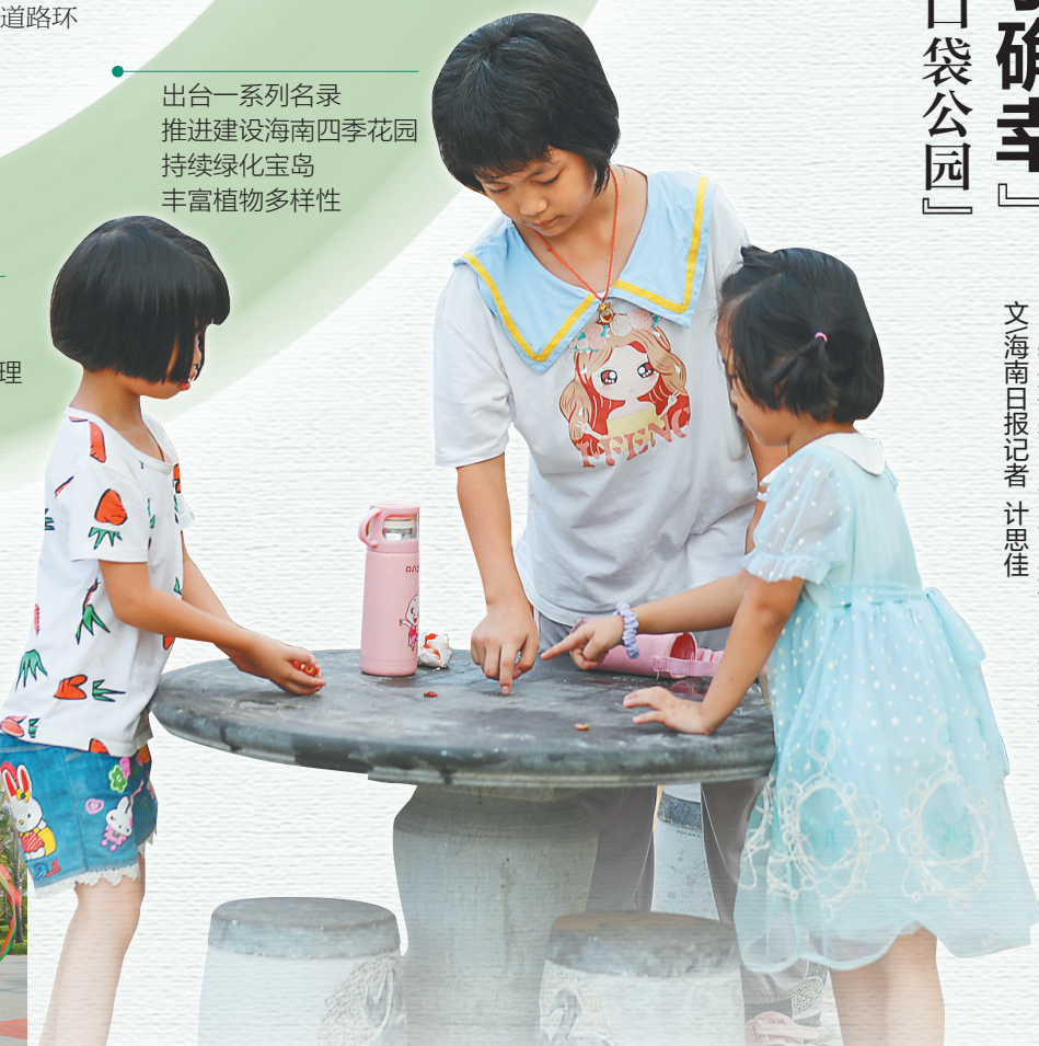
小朋友在海口市骑楼老街中山横路街心公园玩耍。