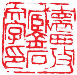
吴昌硕治印 怀西考藏金石文字印

向。如今,作为传统文化的根脉、汉字的源头,甲骨文再一次走进了我们的生活。杭州亚运会火炬“薪火”的设计运用甲骨文的元素,它将象形符号抽象出来,保留其图画性,运用造型线条,使之更生动完美地展现中国几千年的深厚文化。