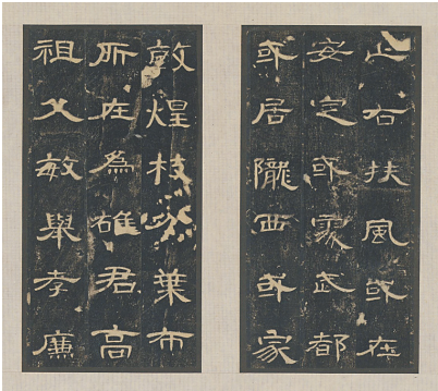
《曹全碑》拓本局部 本版图片均为资料图

法称为“波磔”,而“蚕头燕尾”笔法为波磔之法的经典代表。隶书具有节奏感的运动态势,平直方折中显露笔画的律动之美。其结体在扁方取势中彰显雄阔的形体舒展美,通过不同的笔画组合,构成汉字的扁方形体,以及撇捺之间的左右延展取势。