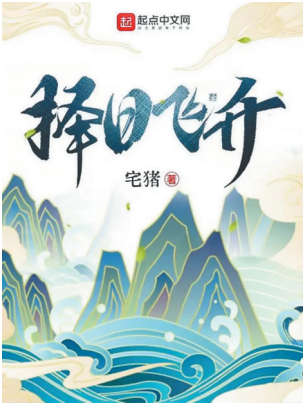
宅猪作品《择日飞升》。

当前,海南网络文学已从野蛮生长的少年期,走向了蓬勃发展的青年期。“凭借独特的地理优势,海南将有望成为以网络文学为主要内容的中国数字文化出海的基地。”省作协主席梅国云说。