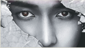
《黄金瞳》的人物造型。