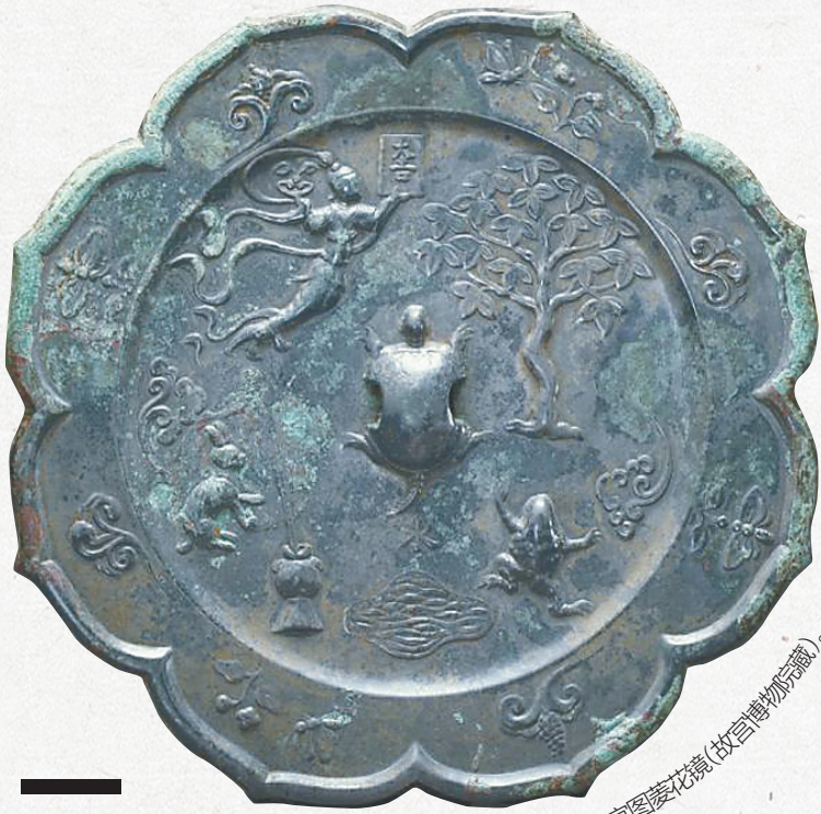
唐“大吉”铭月宫图菱花镜(故宫博物院藏)。

人间八月正是桂花飘香的时节，古代科举考试秋闱的时间也在此时。月宫的桂花自然是美好名贵的代名词，月宫又名蟾宫，故而古人常以“蟾宫折桂”比喻科举及第。《晋书·郗诜传》载：“晋武