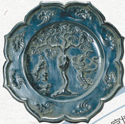
唐月宫图菱花镜(故宫博物院藏)。