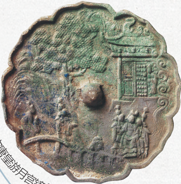
宋唐皇游月宫镜(霍山县文物管理所藏)。