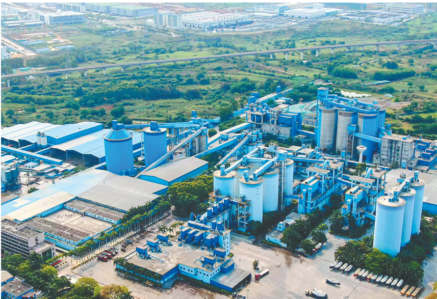
散装水泥生产企业——澄迈华盛天涯水泥有限公司。

目前,海南也正在大力推进以散装水泥应用为核心的预拌混凝土、预拌砂浆、装配式建筑等水泥预制构件一体化的绿色产业体系发展。同时,多渠道、多形式,开展我省散装水泥绿色产业宣传活动,进一步加大散装水泥绿色产业在海南的社会认知度、使用率,引导岛内水泥相关企业转型升级,为海南自由贸易港建设和节能减排作出积极贡献。