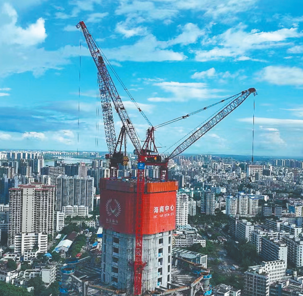
建设中的海南中心项目。

高耸耸立的摩天大楼从19世纪末诞生的那一刻起,就成为城市繁荣的象征,而不断刷新的摩天大楼高度纪录,书写的更是一段段建筑和城市发展史的传奇。