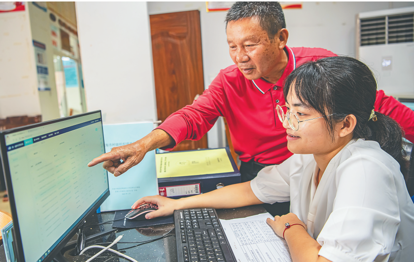
9月27日,琼海市塔洋镇珍寨村委会工作人员将村民申请办理的事项录入电脑管理。