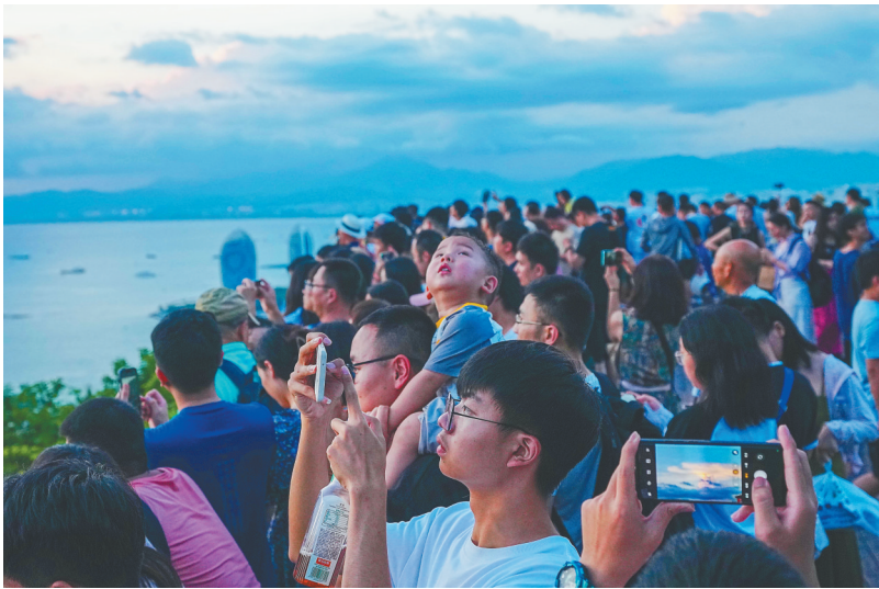
↑在三亚市鹿回头风景区，众多游客漫步游玩，共赏晚霞。