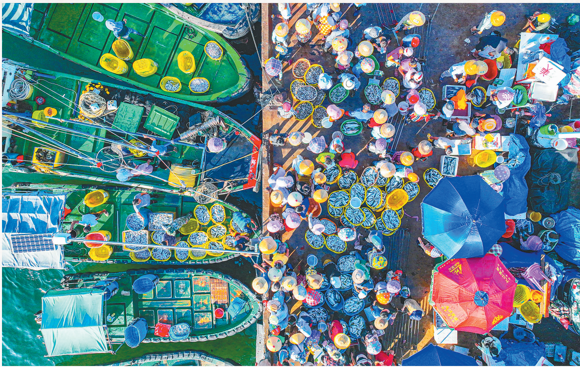
早晨,热闹的陵水新村疍家渔港,新鲜的渔获堆满码头。

目前,海南陵水是疍家人聚居人数最多,也是最为集中的地方,约有3000多户,1.5万人,有渔排400余户,船舶1700余艘,时至今日仍有部分疍家人在海面上生产生活。