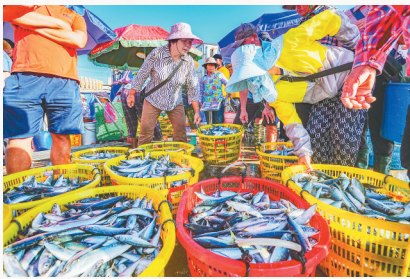
陵水新村疍家渔港,渔民和他们的渔获。