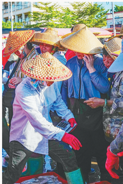
陵水新村疍家渔港,渔民和买家在交易。