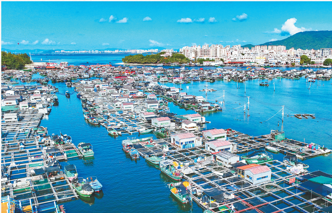
陵水新村潟湖上,一排排漂浮海面的疍家渔排,形成了广阔的海上村落。