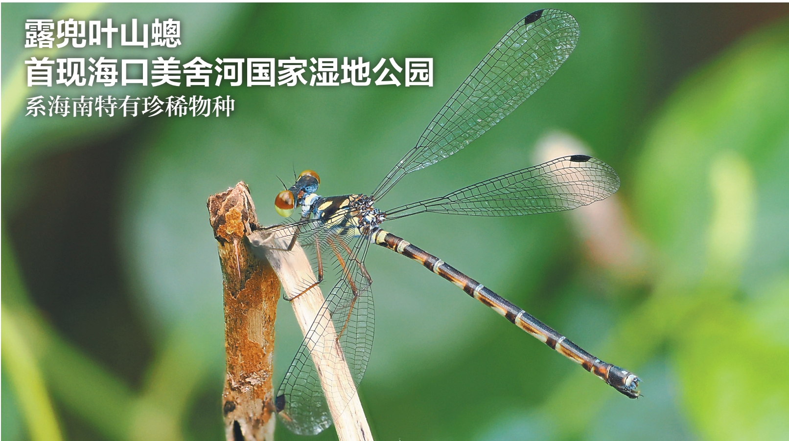
10月8日，露兜叶山螳首次现身海口美舍河国家湿地公园。

本报海口10月9日讯（记者刁霖鸿 见习记者王赫）10月8日，海南特有珍稀物种——露兜叶山螳（cōng）首次现身海口美舍河国家湿地公园。 海口番替湿地研究所所长卢刚介绍，10月8日，他和同事在美舍河国家湿地公园开展生态调查时，发