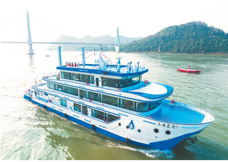
长江湖北宜昌水域。十月十一日，“三峡氢舟1”号行驶在宜昌水域。

“我们研制了基于光纤时间延迟环的超导纳米线探测器，首先把多光子态分束到不同空间模式，然后通过延时把空间转化为时间，实现了准光子数可分