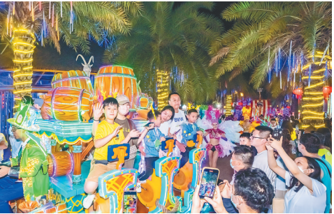
游客在三亚海昌梦幻海洋不夜城参与花车巡游。