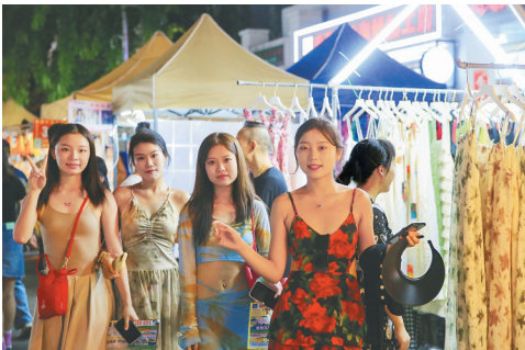
游客在三亚红旗街逛夜市。

头风景区婚姻登记处，提供婚姻家庭辅导、家庭关系调适、集体婚姻颁证、简约婚礼场景、婚前医学检查等功能融合、形式新颖的婚姻登记延伸服务，营造健康向上、简约内涵的文明新婚俗氛围，推动婚俗改革落到实处。