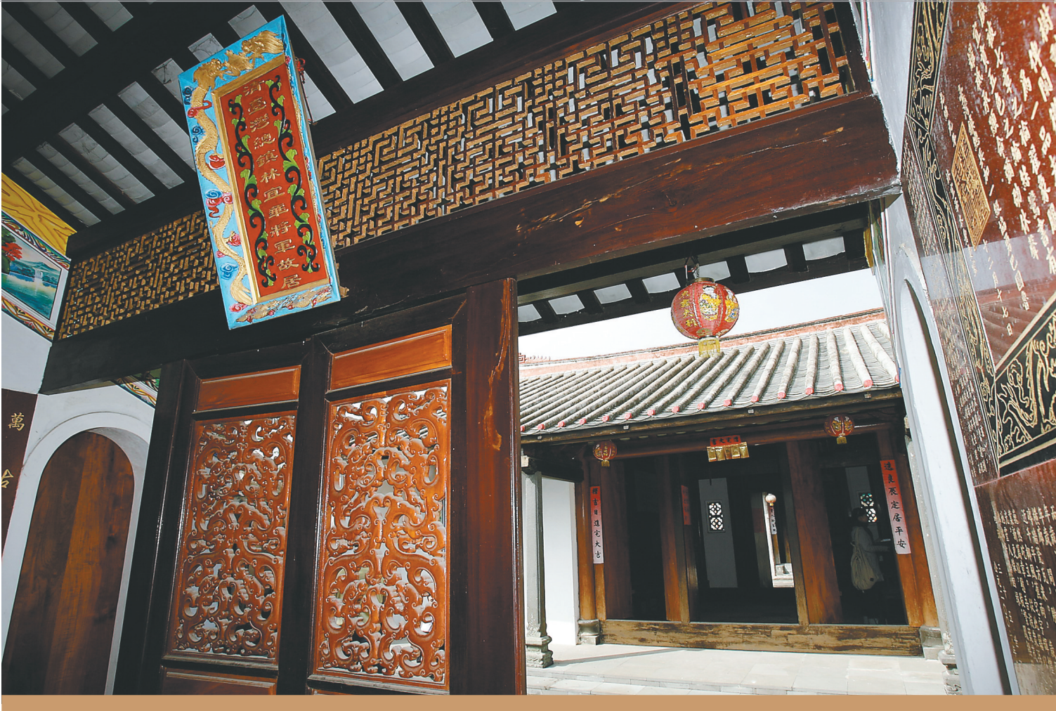
清代海南籍武将林宜华故居。