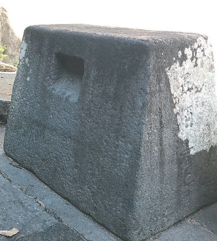
林宜华故居里的练功石。

拂去历史的厚重尘埃，再次了解到这位琼州古代将星的历历往事，依然能感受到他勇猛无畏、为国守疆的英烈豪气。