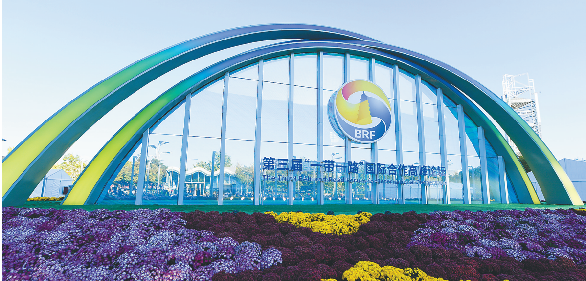
在北京国家会议中心附近拍摄的第三届“一带一路”国际合作高峰论坛景观布置。

家、30多个国际组织的代表已确认与会，包括有关国家领导人、国际组织负责人、部长级官员及工商界、学术机构、民间组织等各界人士。参会嘉宾注册人数已超过4000人。