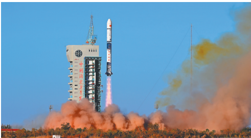
图为发射现场。

吸引力还来自广交会平台不断优化的开放实效。以“服务高质量发展，推进高水平开放”为主题，本届广交会着力打造集资讯交流、创新发布、产业推介、贸易服务等多功能于一体的综合平台。展会期间，将举办全球采购推介系列活动、60余场“贸易之桥”全球贸易对接活动。（据新华社广州10月15日电 记者丁乐 孟盈如）