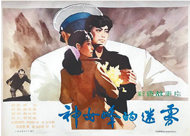
《神女峰的迷雾》海报。