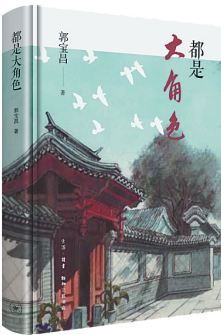
郭宝昌著作《都是大角色》。