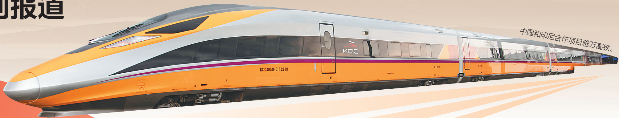
中国和印尼合作项目雅万高铁。