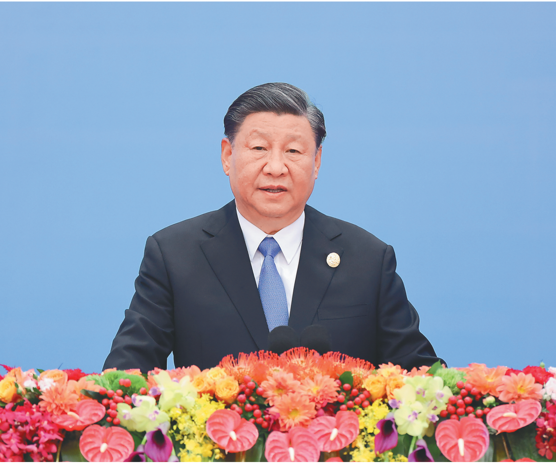
10月18日上午,国家主席习近平在北京人民大会堂出席第三届“一带一路”国际合作高峰论坛开幕式并发表题为《建设开放包容、互联互通、共同发展的世界》的主旨演讲。