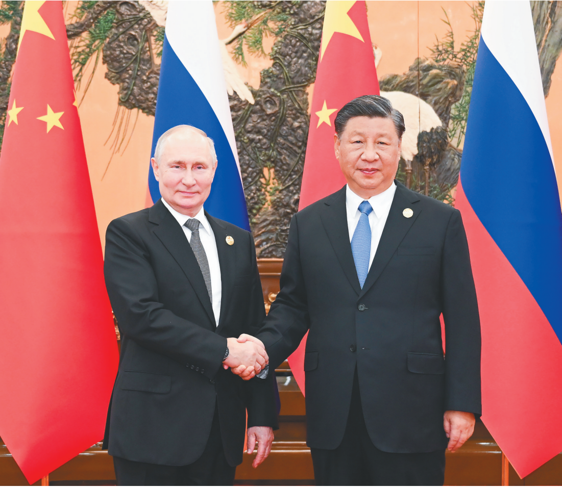
十月十八日中午,国家主席习近平在北京人民大会堂同来华出席第三届“一带一路”国际合作高峰论坛的俄罗斯总统普京举行会谈。