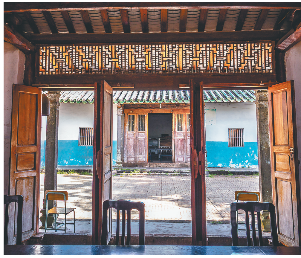
翰香书院主体建筑内部构造。