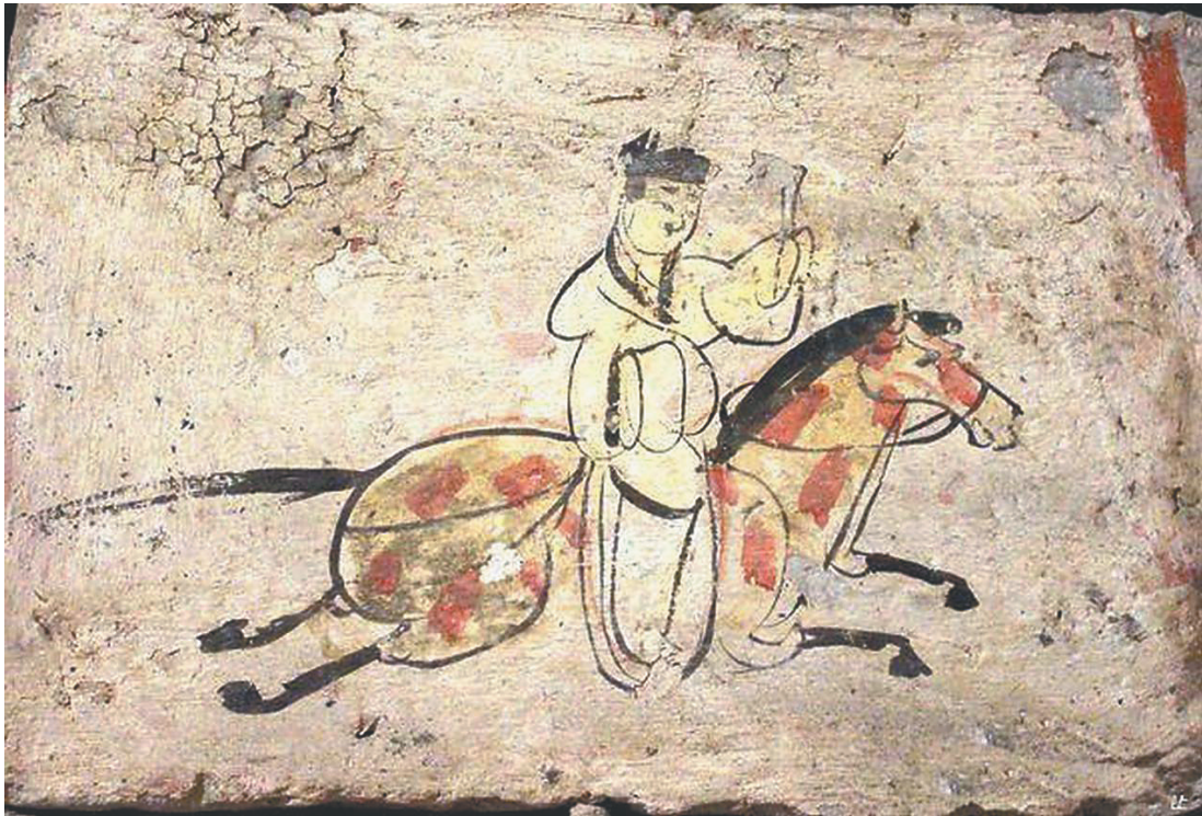
甘肃嘉峪关魏晋墓壁画上的《驿使图》。

实际上，邮政活动在古代中国就已经产生并发展成为一个行业。邮政的历史从何而起，历朝历代的人们如何收寄物品，是靠“飞鸽传书”还是“龙门镖局”？今天让我们搭乘时光穿梭机，一起去探究古代邮事。