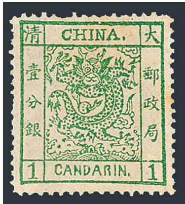
我国第一套邮票晚清大龙邮票。

经济社会不断发展，邮政行业亦是日新月异。如今，得益于发达的互联网技术和立体交通体系，老百姓收寄邮件只需动动手指，便可享受上门服务，真正实现了“物畅其流”。