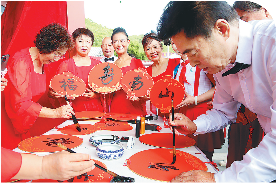
↑海南三亚市老教授协会的老人们在南山景区创作书法作品。

10月23日是重阳节，各地举办丰富多彩的主题活动，弘扬中华民族优秀传统文化，营造敬老爱老的社会氛围。