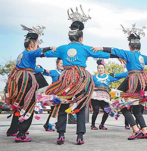
10月23日，在贵州省黔东南苗族侗族自治州丹寨县扬武镇敬老院，志愿者为老人们表演苗族传统舞蹈。