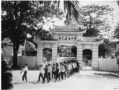
海南中学的前身广东海南中学校门。