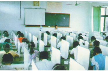
海中学生在语音教室上课。

穿越一个世纪，海南中学即将迎来建校一百周年，让我们一起走近这座百年学府，探究她的建校历史、发展脉络和精神气质。