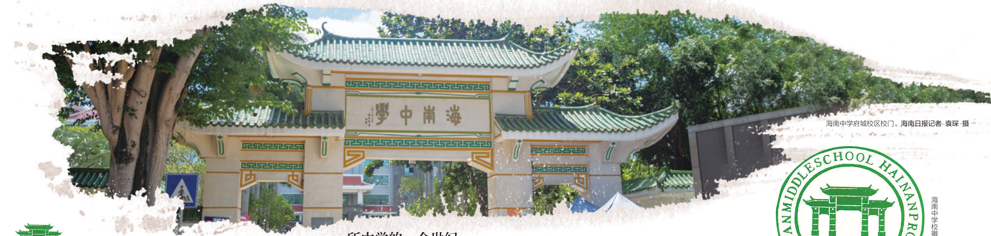
海南中学府城校区校门。