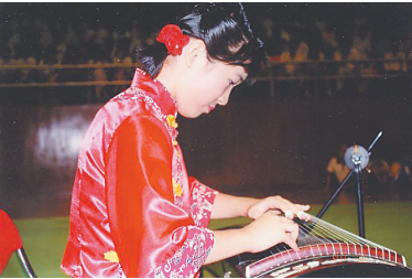
海中学生在演奏乐器。