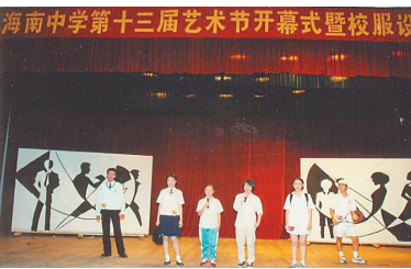
海中学生参加校园艺术节。