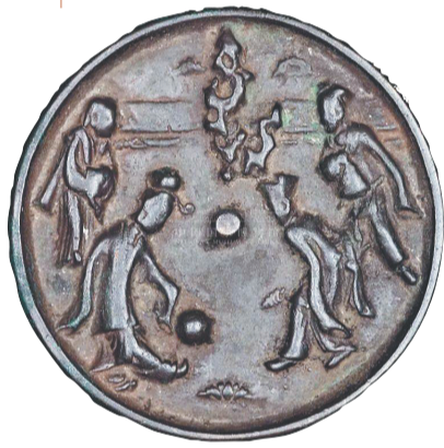
蹴鞠纹青铜镜 宋 现藏于中国国家博物馆

近日,全国女子足球公开赛在海南琼中开幕,不少观众在关注赛事的同时也探究起了足球的历史。众所周知,现代足球的前身是中国古代的蹴鞠,很多人知道古代男子喜欢蹴鞠,却鲜有人知道古代女子也在蹴鞠场上留下了一串灿烂的足迹。