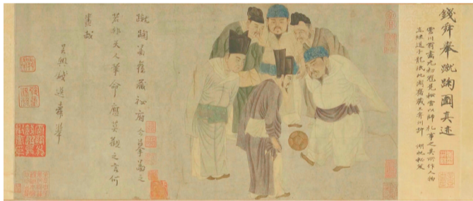
《蹴鞠图》局部 元 钱选 现藏于上海博物馆

画家钱选是宋末元初的著名画家,与赵孟頫被称为“吴兴八俊”之一。其曾在景定三年中进士,入元后不仕,以书画终其身。他的书画成就在近现代大收藏家吴湖帆的题跋里可见一斑:“雪川翁(钱选的号)画,元初冠冕,松雪以师礼事之。其所作人物,直继道子、龙眠。”其被赵孟頫执以师礼事之,其所作人物可直追吴道子、李公麟项背。