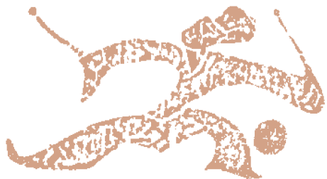
汉 乐舞蹴鞠 画像砖(拓片)