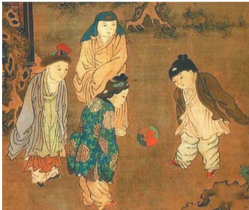
《长春百子图卷》局部 宋 苏汉臣 现藏于台北故宫博物院