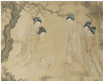
《仕女卷》局部 明 杜堇 现藏于上海博物馆