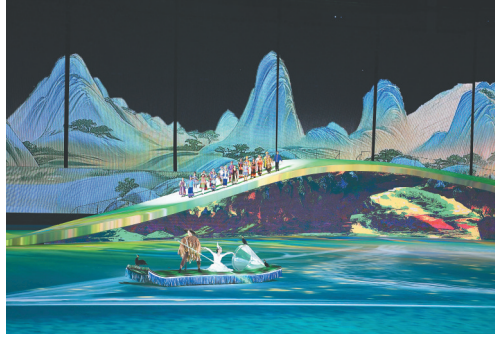
演员在开幕式现场表演。

新华社南宁11月5日电 (记者徐海涛 吴俊宽) 11月5日,第一届全国学生(青年)运动会在广西壮族自治区南宁市开幕。国务委员谌贻琴出席开幕式并宣布开幕。