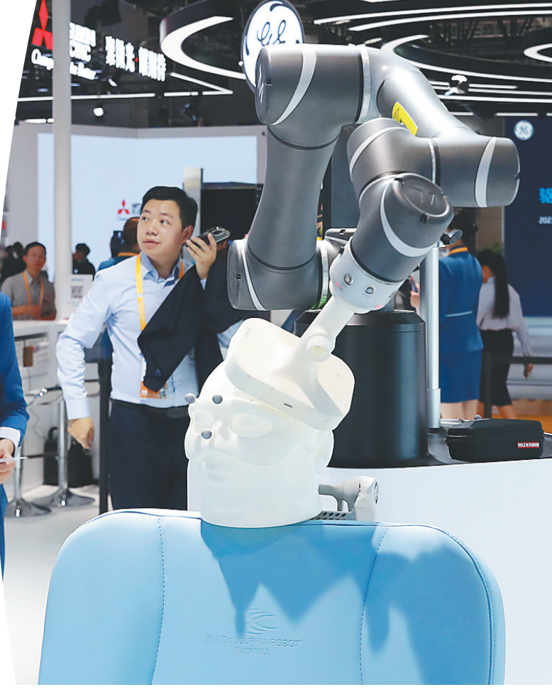
欧姆龙公司展出的黑海豚靶向磁刺激机器人展品。