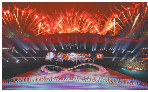
开幕式焰火表演。