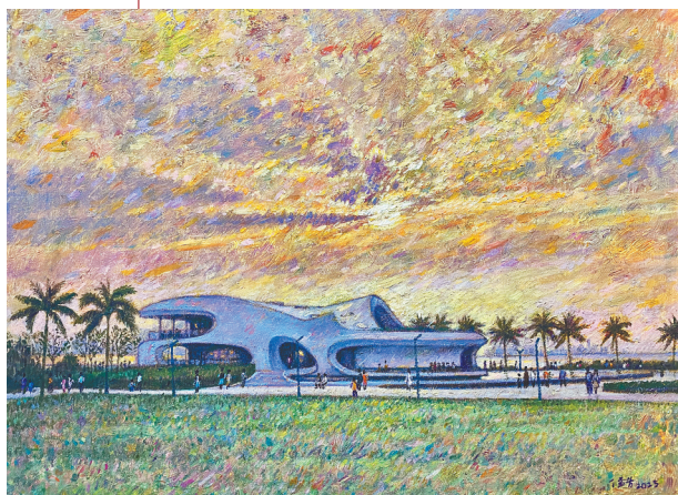
《椰城风景线·云洞炫辉》(油画) 丁孟芳 作

在这次展览中,我们可以看到,80%以上参展的艺术家都很年轻,海口各中小学校的美术老师是这支艺术家队伍中难能可贵的“新鲜血液”,由此可见,海南美术事业可持续发展后继有人。