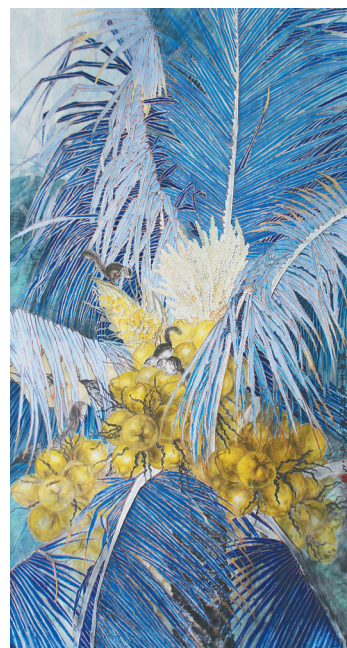
《硕果累累》(中国画) 陈燕秀 作