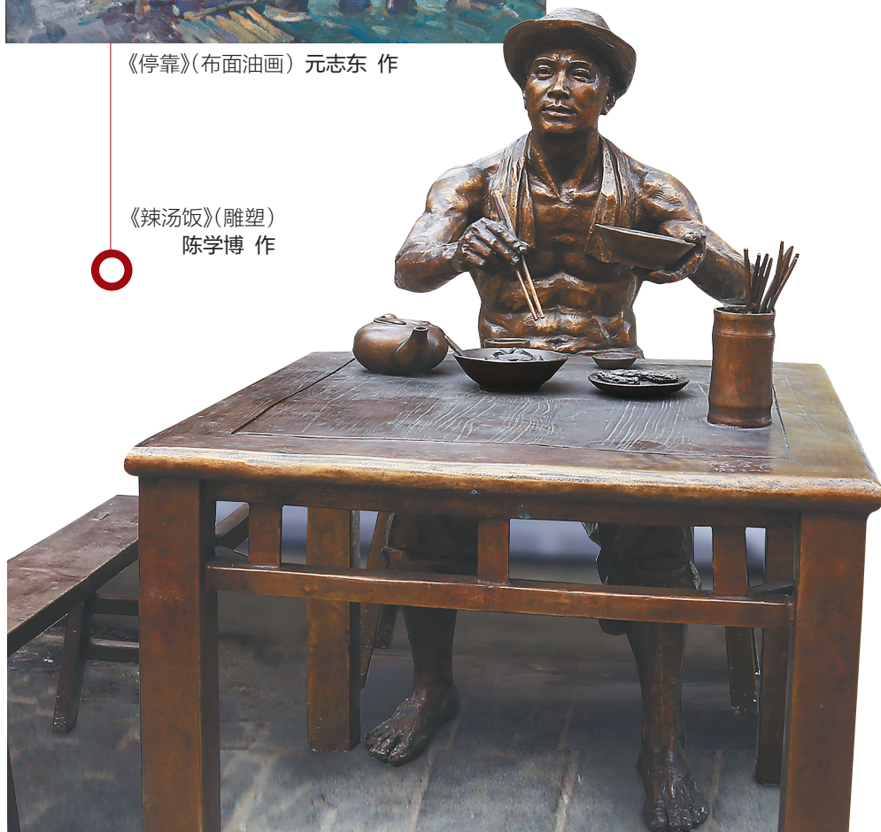
《辣汤饭》(雕塑) 陈学博 作