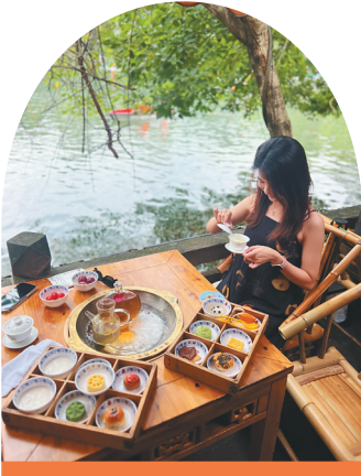
成都茶社吸引年轻女孩前去体验。

川渝,是很适合遛弯的地方,城市景观够丰富,人文性格够鲜明,城市生态够多元,一路上走走逛逛便能邂逅千般独特景致。