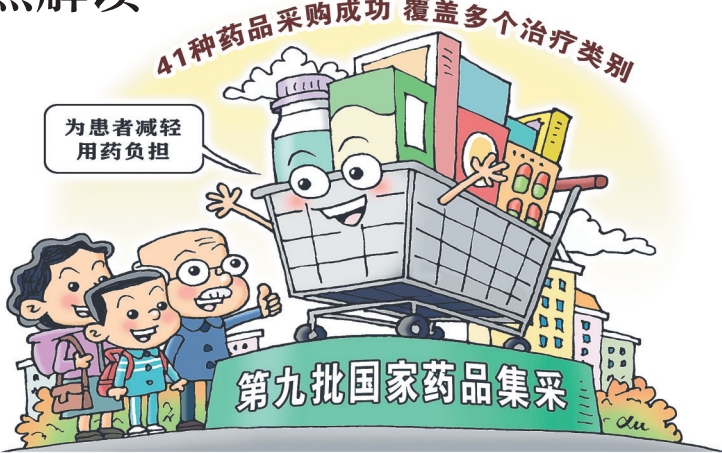
41种药品采购成功 覆盖多个治疗类别

在以往的企业拟中选资格规则基础上，此次集采进一步优化创新淘汰机制。“最高单位可比价/最低单位可比价”计算比值最大的前 4 名和最小的前 2 名也会被淘汰。专家认为，这一规则既有效控制了不同中选企业之间过大的价格差异，也进一步规范了企业投标行为。