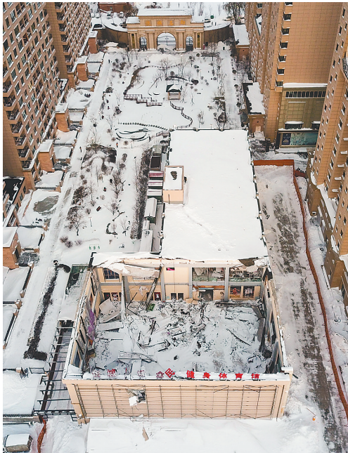
图为 11 月 7 日拍摄的发生屋顶坍塌事故的黑龙省桦南县悦城体育俱乐部。

佳木斯市医疗专家组已赶赴桦南县，按照“一人一方案”的原则，全力以赴开展救治。有关专家同步对伤员、家属进行心理疏导。为避免次生事故发生，公安机关对事故现场进行封控，悦城体育俱乐部负责人等已被警方控制。市县两级纪检监察机关第一时间介入，成立调查组开展调查。善后工作正在有序进行中。