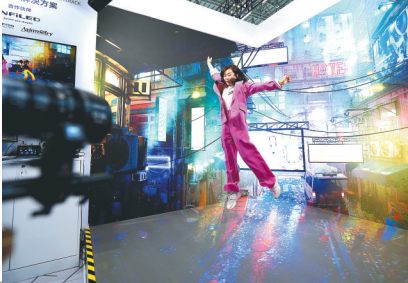
→11月7日，在第六届进博会技术装备展区，观众与“虚拟制片”设备进行互动。

截至目前，中央企业交易团、国家卫生健康委交易团、相关地方交易团共举办 85 场集中签约活动，达成合作意向近 600 项。