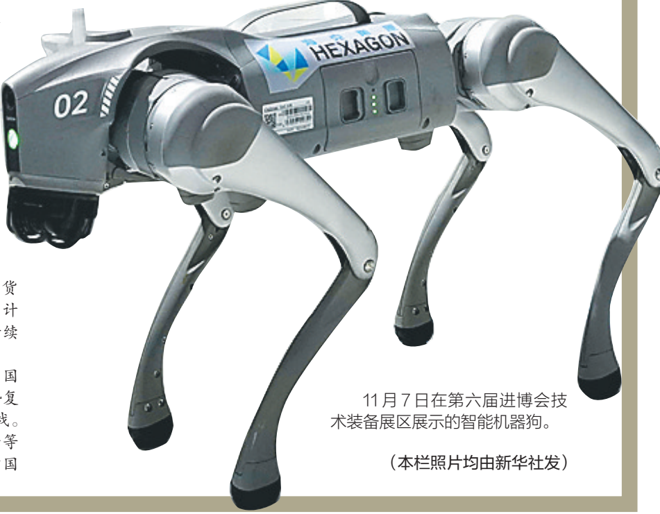
11月7日在第六届进博会技术装备展区展示的智能机器狗。