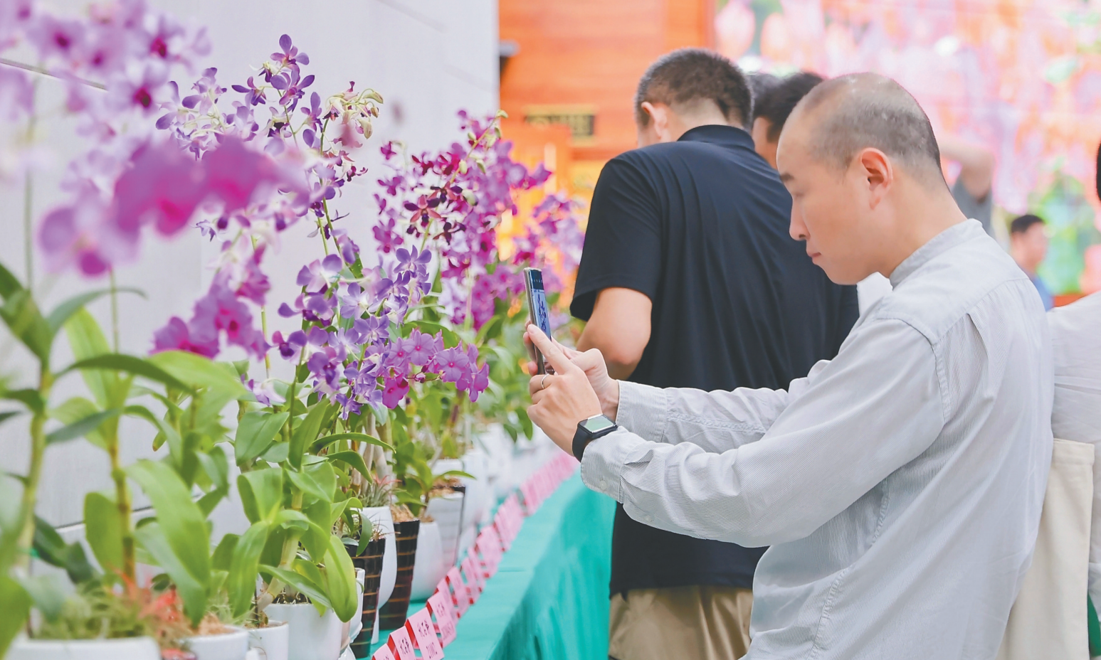
十一月七日，中国热带农业科学院在海口举办推介会，集中推出一百五十个花卉新品种。图为参会嘉宾在现场拍照。