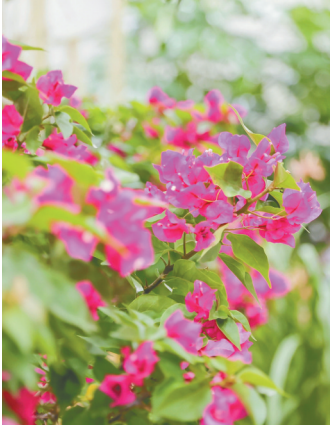
推介会上展出的花卉。

这场推介会都有哪些新奇花卉？在各方交流互鉴中能洞见怎样的产业新趋势、新机遇？海南日报记者就此进行了采访。