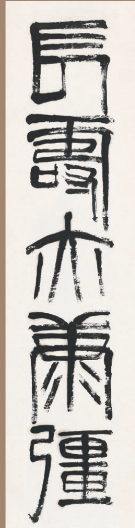
齐白石的书法作品。