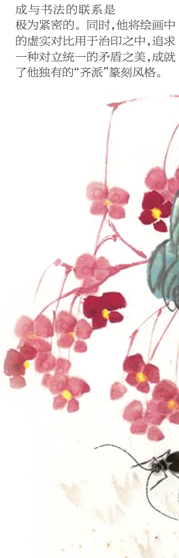
《草虫秋海棠》。本版图片均为资料图