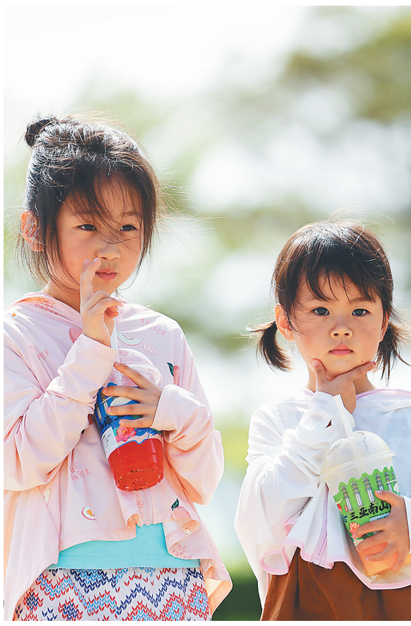
孩子在三亚南山文化旅游区内游览拍照。

据了解,本次评选旨在通过打造一批有代表性、有影响力的体育旅游精品景区、线路、赛事、目的地等方式,满足群众对体育旅游的选择需求,进一步推动体育与旅游深度融合发