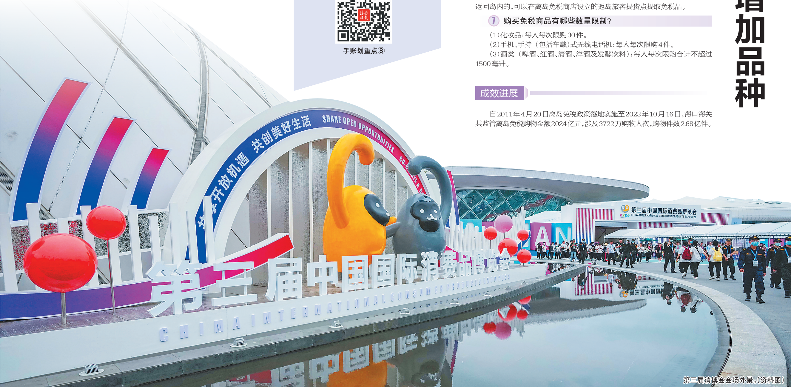
第三届中国国际消费品博览会会场外景。(资料图)

自2011年4月20日离岛免税政策落地实施至2023年10月16日,海口海关共监管离岛免税购物金额2024亿元,涉及3722万购物人次,购物件数2.68亿件。