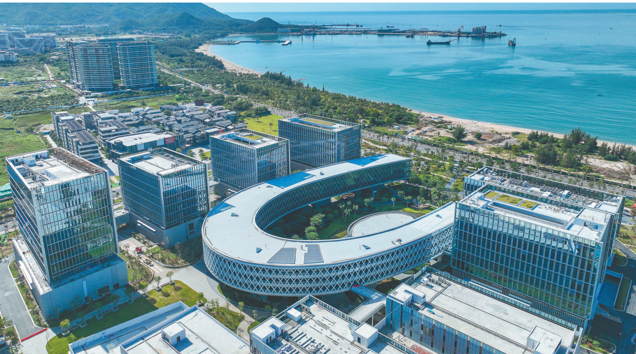
崖州湾科技城深海科创公共平台建设加快收尾

质量品牌建设作为公司三项基础性工作之一。回归国资以来,机场板块实现涅槃重生,以全新品牌形象亮相,迈入新发展阶段。 据了解,作为展示中国自主品牌形象的重要活动平台,中国品牌节于2006年在北京倡议发起,自2007年起已举办16届。