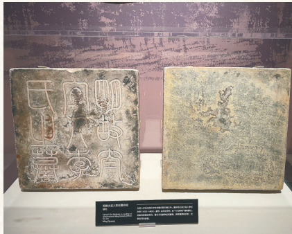
明故太宜人李氏（丘濬之母）墓志铭。

不得不说，丘濬的成才与李氏的言传身教、丘家的严正家风密切相关。后来，对海南古代教育颇有贡献、清康熙年间任分巡雷琼兵备道的焦映汉在《丘文庄公传》中云：“（丘濬）母李氏守志食贫，顾复教诲，有孟母风。”