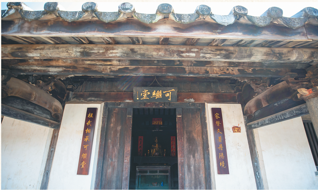
丘濬故居里的可继堂。

丘濬七岁失怙，在祖父与母亲的教诲下，他严于律己，勤俭好学，后考中进士，入仕为官，但一生都带着“廉介”之风。严正的家风，丘家一代代传承了下来。父慈子孝，勤俭节约，勤学好读，从丘濬的后代身上，可见丘家遗风。