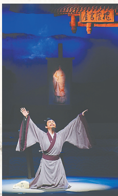
琼剧《丘濬》中的丘濬。