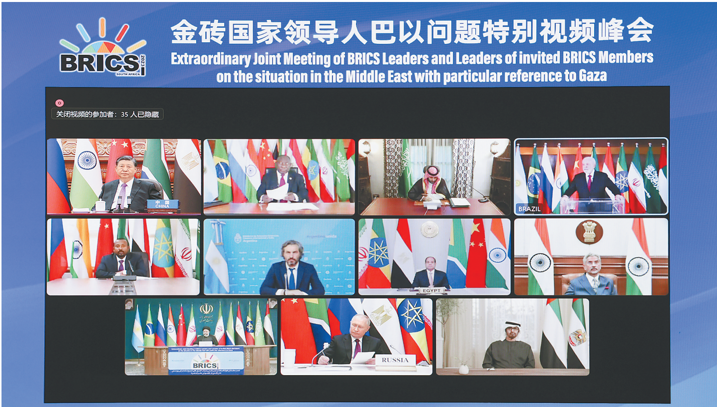
11月21日晚，国家主席习近平出席金砖国家领导人巴以问题特别视频峰会并发表题为《推动停火止战 实现持久和平安全》的重要讲话。

罚。三是国际社会要拿出实际举措，防止冲突扩大、影响整个中东地区稳定。各方应该将联合国大会和安理会有关决议要求落到实处。 习近平强调，巴以局势发展到今天，根本原因是巴勒斯坦人民的建国权、生存权、回归权长期遭到漠视。解决巴以冲突循环往复的根本出路是落实“两国方案”，恢复巴勒斯坦民族合