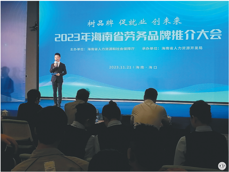
11月21日,我省首届劳务品牌推介大会在海口举办。图①为“推介官”以路演方式介绍相关劳务品牌;图②为“琼字号”劳务品牌名称集中展示区;图③为劳务品牌推介大会主会场。