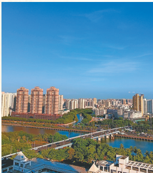
海口连接市中心和海甸岛的和平桥，桥的南侧可见汇入海甸溪的美舍河。

“海府地区”经历了怎样的变迁？藉由文献记载和古代舆图，今人还是可以窥见其脉络和轮廓。