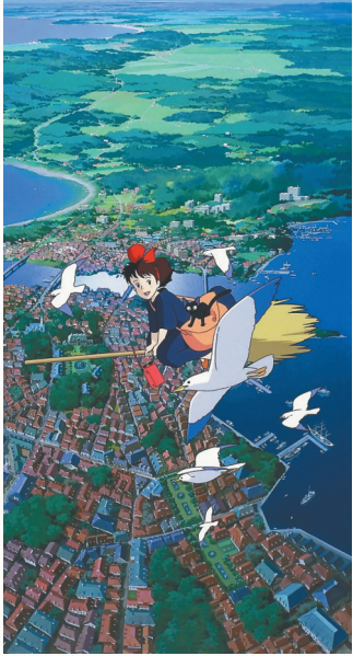
《魔女宅急便》海报。 本版图片均为资料图