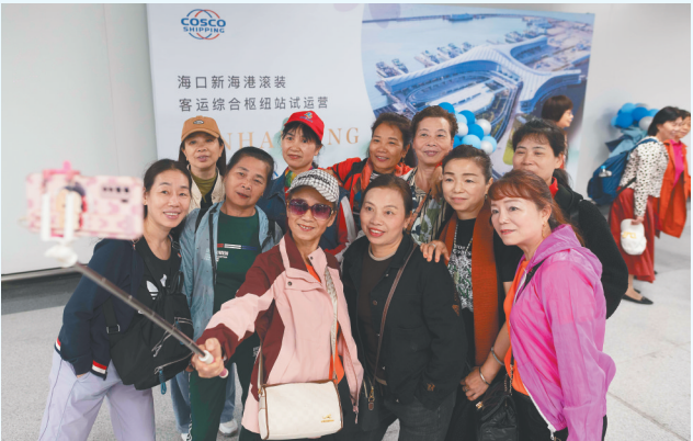
首批旅客在登船前留影。

本报海口11月29日讯（记者郭萃 曹马志）11月29日，海口新海滚装码头客运综合枢纽站（以下简称新海客运综合枢纽站）建筑体昵称征集结果公布，本次昵称征集活动经过8天的激烈角逐，后台共收到了超100万次投票，选出了最终名称——望海口。 为进一步打造海南自贸港门户品牌形象，提升新海客运综合枢纽知名度，海南海峡航运股份有限公司对新海客运综合枢纽站开展昵称征集活动，以塑造海口地标新名片。 “例如广州塔昵称为‘小蛮腰’，北京国家体育场为‘鸟巢’，我们希望能够用一个既突出地方特色，又雅俗共赏、简洁易记的名称，让新海客运综合枢纽站被更多人熟悉。”海南海峡航运股份有限公司相关负责人说。 经过征集、评选、公示投票等环节，最终“望海口”以38.86万票当选。据了解，该名称释义为“风入海口来，椰风海韵去，海浪奔腾急，琼州望海口。”其意一语多关，既有海口真名，又有地形之势。望，既有希望、渴望之意，又有望山海同川、海天一色，朗朗上口，直抒胸臆。