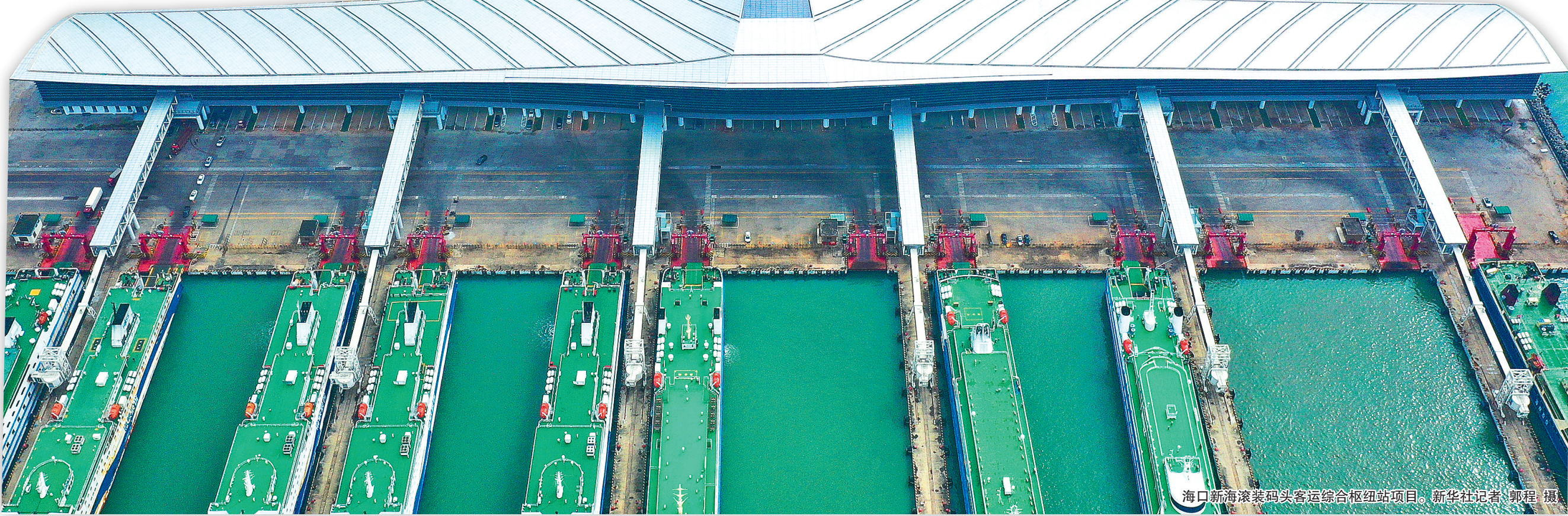
海口新海滚装码头客运综合枢纽站项目。