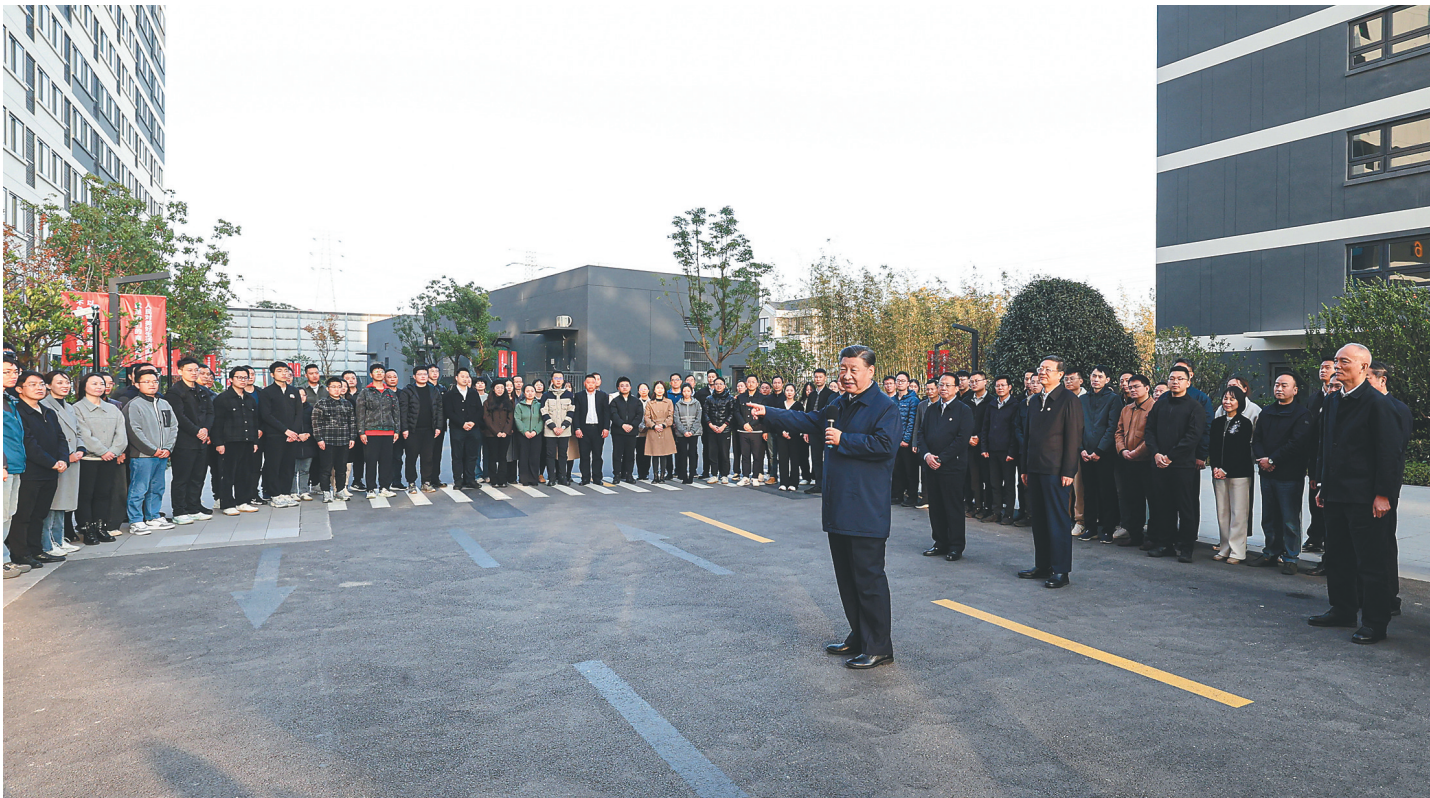
11月28日至12月2日，中共中央总书记、国家主席、中央军委主席习近平在上海考察。这是11月29日下午，习近平在闵行区新时代城市建设者管理者之家，同社区居民亲切交流。

新华社上海/江苏盐城12月3日电 中共中央总书记、国家主席、中央军委主席习近平近日在上海考察时强调，上海要完整、准确、全面贯彻新发展理念，围绕推动高质量发展、构建新发展格局，聚焦建设国际经济中心、金融中心、贸易中心、航运中心、科技创新中心的重要使