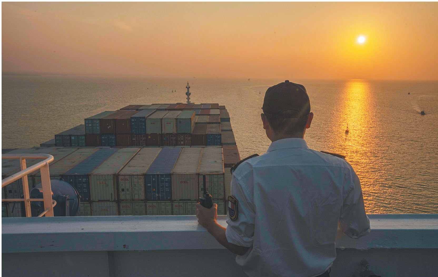
引航员在观察轮船前行的航道。