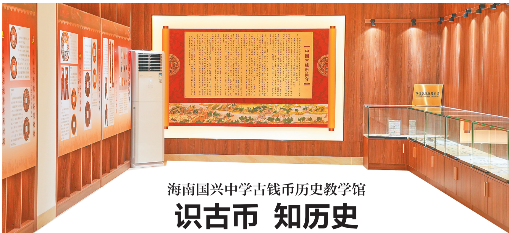
国兴中学古钱币历史教学馆内部一隅。