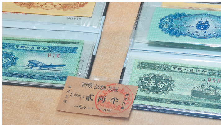
第三套人民币分票和地方糕点证。