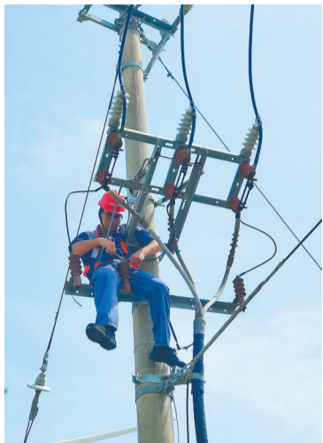
符亲章维修电力设备。