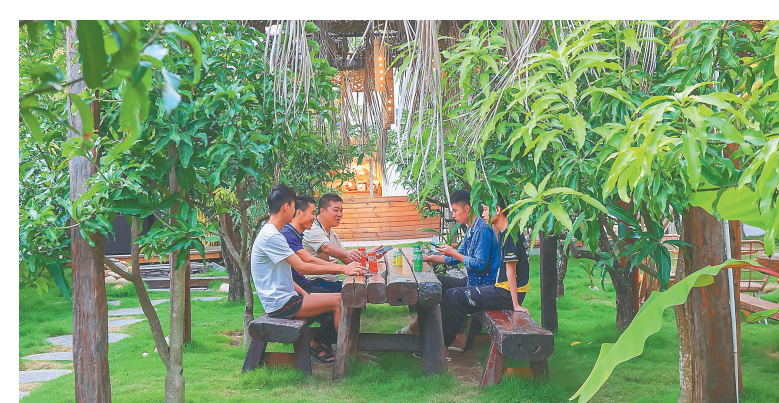
三亚水蛟村水蛟小院,游客围坐在一起聊天。

六盘村举办“食缘之旅·邂逅鹿城乡愁”为主题的乡村美食节,设置美食集市、车尾箱集市、趣味游戏和精彩表演等体验,助推六盘村特色美食一条街的经营。美食节期间游客超5万人次。 场内球员打得尽兴,场外观众看得过瘾,欢呼声和掌声回荡在球场上空……该市还举办2023年和美乡村篮球大赛,通过主客场赛制,打造流动的赛场集市,并联动区域旅游、文化、美食、特色产业等资源,推介乡村美景好物。 “丰富的乡村文体活动,展示出一方水土的特有内涵,形成了巨大的溢出效应,成为乡村产业高质量发展新的支撑点。透过一场场活动,也让大家看到健康、鲜活、自信的新农人面貌,富裕、积极、向上的美丽乡村风貌。”何丽萍说。 (本报三亚12月5日电)