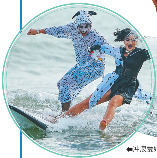
冲浪爱好者以角色扮演形式冲浪。

近日,第二届后海冲浪文化周活动在三亚后海举办。本次活动除了技能大比武赛事,还包含冲浪装备展、冲浪沙龙、冲浪文化展、环保活动等,吸引了众多冲浪爱好者以及市民游客前来体验、感受后海冲浪文化。