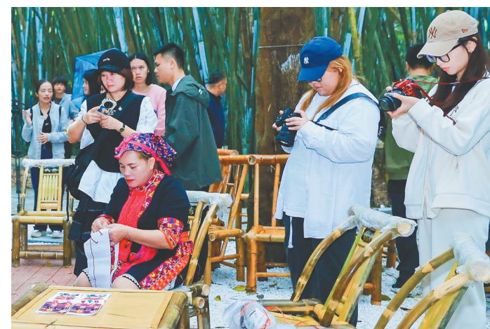
美鹤园村村民展示苗绣技艺。