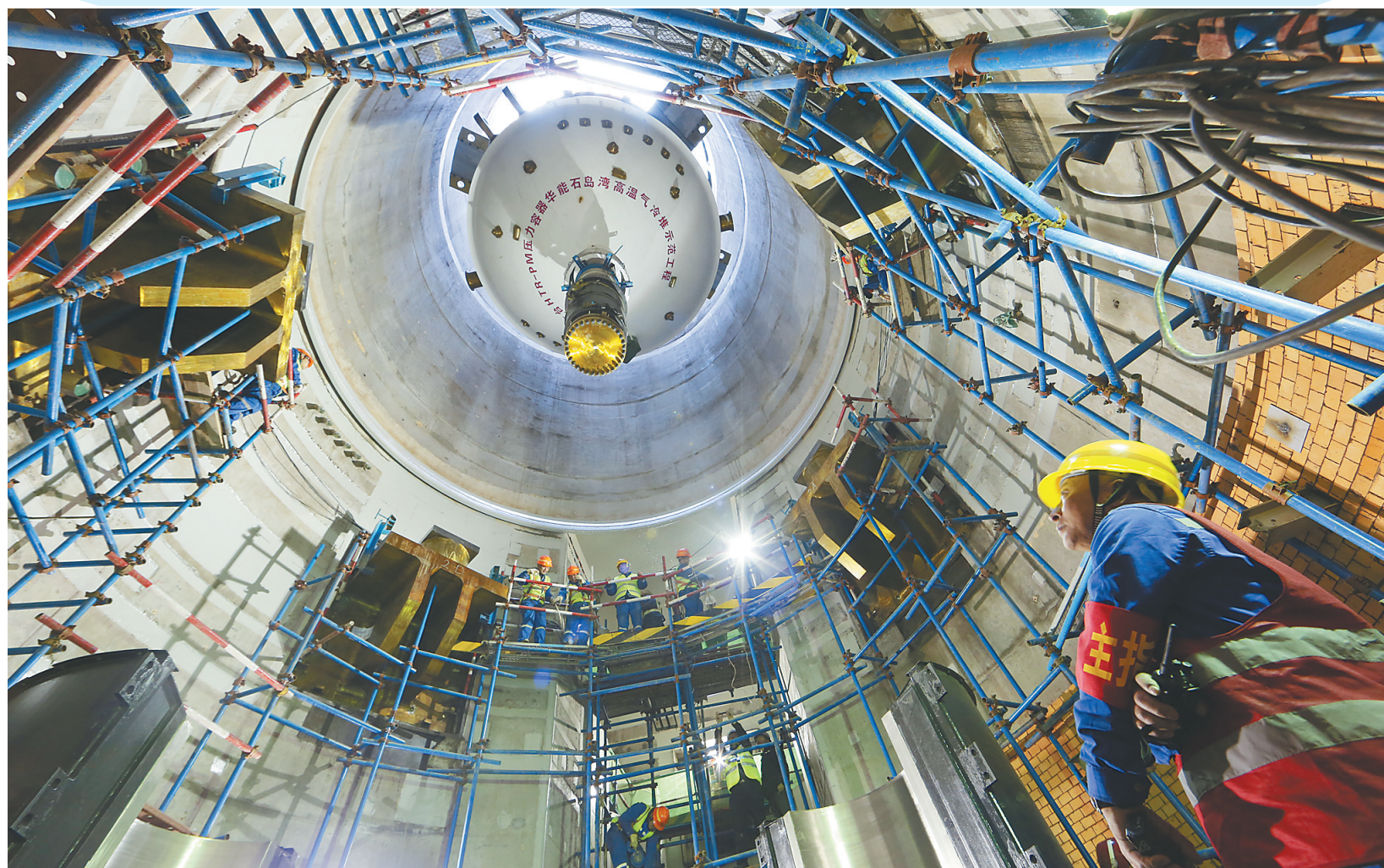
华能石岛湾高温气冷堆示范工程首台反应堆压力容器吊装就位。