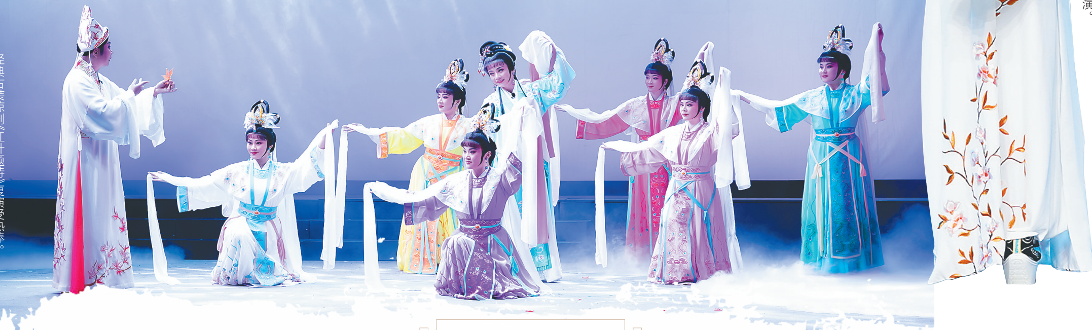
琼剧新秀登台表演。