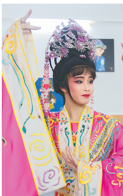
演员在进行基本功练习。