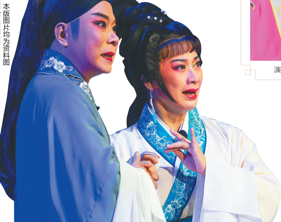
本版图片均为资料图

省琼剧院院长杨济铭认为，经典作品的当代呈现，同样是创作的应有之义，通过经典复排，不仅守住琼剧精华，弦歌不辍，更以创新的理念、现代的审美激活经典琼剧在新时代的生命力。