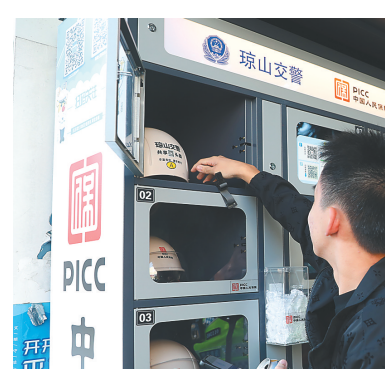
12月8日下午，海口市民在执勤交警的指导下，租借共享头盔。

周平虎说，共享头盔项目属于公益性质，也是保险公司履行社会责任的体现，在运营中要优化流程、规范管理，属地交警部门依法予以监督。同时，交警也呼吁市民，文明使用“共享头盔”，保持头盔的干净、整洁，使用后及时归还，方便下