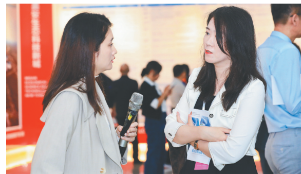
在海口国家高新区美安生态科技新城,与会人员与园区工作人员(左)交流。