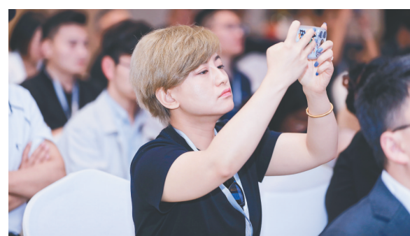
在海口复兴城产业园,人力资源服务机构代表在拍照记录。