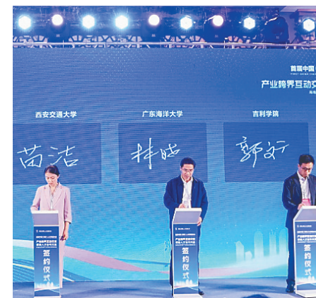
集中签约仪式现场。

本报海口12月10日讯(记者郭菲)12月9日上午,海口国家高新区在“中国(海南)人才交流大会——海南自贸港人才融合发展论坛”上举办2023年海口国家高新区“政校战略合作”签约仪式。本次共有省内外24所院校与海口高新区签约。