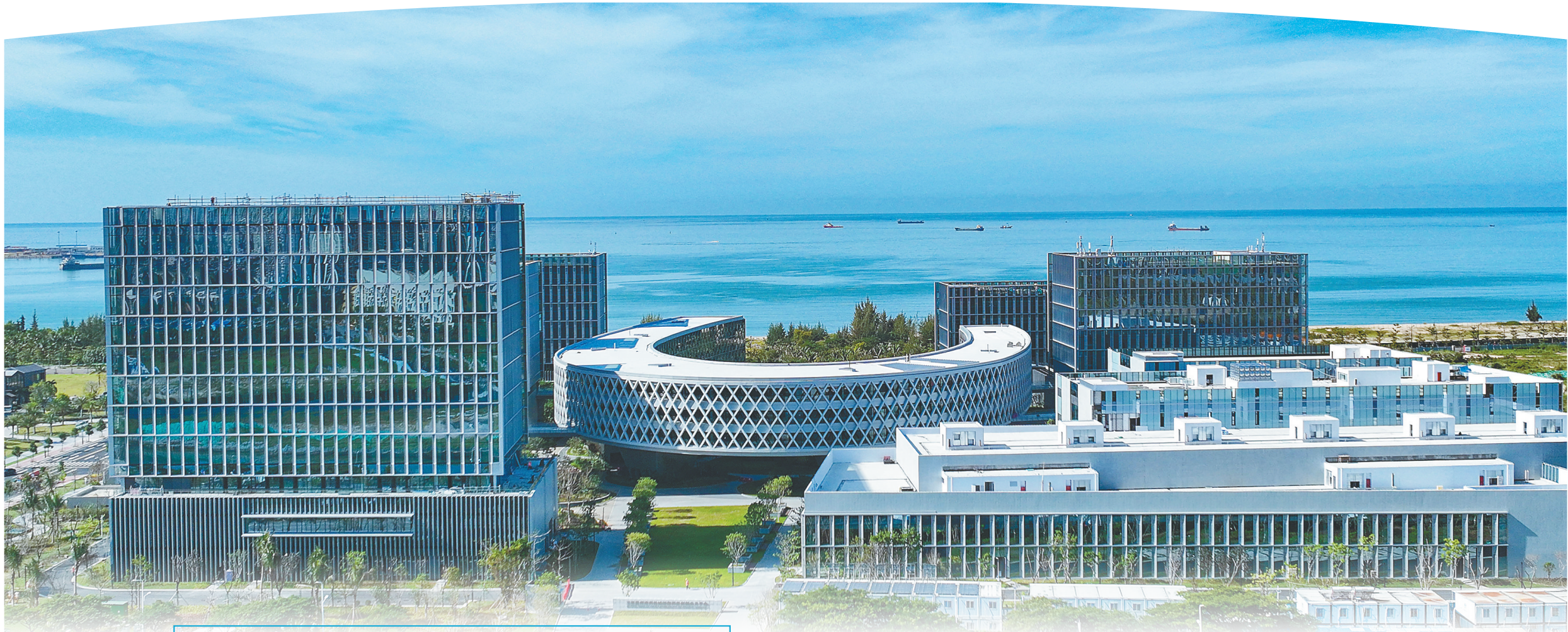
俯瞰三亚崖州湾科技城深海科技城创新公共平台项目。