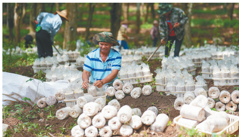
白沙青松乡发展林下菌菇产业。

接下来，白沙将持续做好兴产业、促就业的“两业”文章，想方设法帮助农户拓宽致富增收渠道。