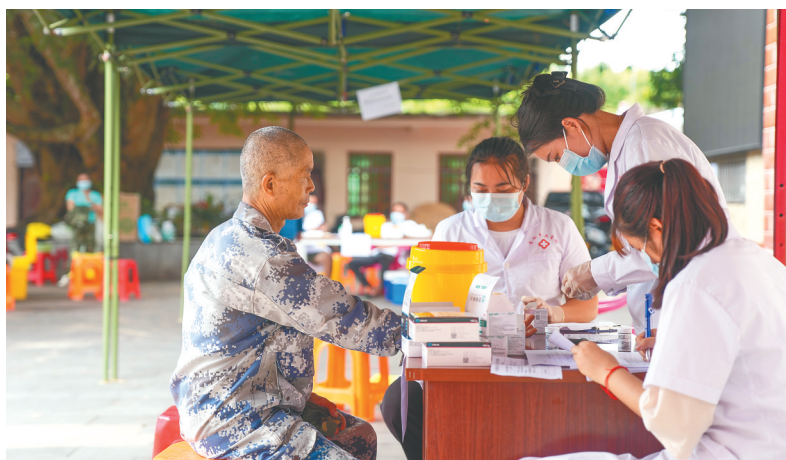
白沙开展“2+3”健康服务筛查。